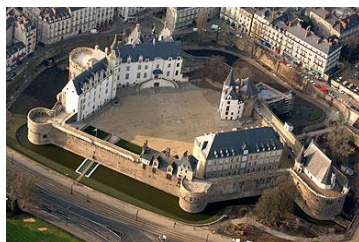
* Château des Ducs de Bretagne (Nantes) * Château de Goulaine (Haute-Goulaine)