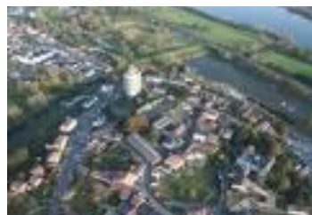
* Champtoceaux * Le Cellier * Oudon

Flânerie dans 1 brocante, Ballades dans les villes du Vignoble et à Nantes, Visites de châteaux et Halte gustative ont été au programme :