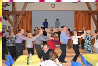
« La Chenille »