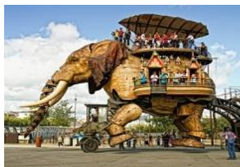
* Eléphant des Machines de L'île (Nantes)