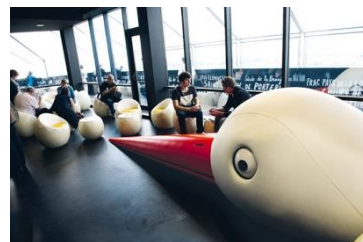
* Café au NID Bar situé au 32 ème étage de la Tour Bretagne (Nantes)